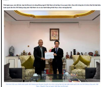
Các đối tác và bạn bè Brunei chúc mừng Đại hội lần thứ XIV Đảng cộng sản Việt Nam

3 Brunei gửi thư chúc mừng, đánh giá cao năng lực tự cường kinh tế, quốc phòng–an ninh của Việt Nam và kỳ vọng Đại hội XIV mở ra giai đoạn phát triển mới.