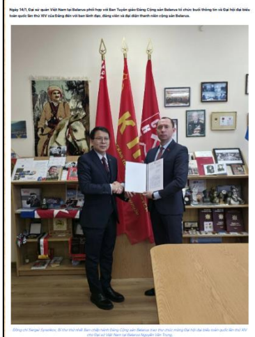
Đảng Cộng sản Belarus trao thư chúc mừng Đại hội XIV của Đảng Cộng sản Việt Nam

1 Đảng Cộng sản Thụy Sĩ chúc mừng thành tựu Đổi mới của Việt Nam, tin tưởng Đại hội XIV sẽ thành công và đánh giá cao lập trường ngoại giao, an ninh quốc gia của Việt Nam.