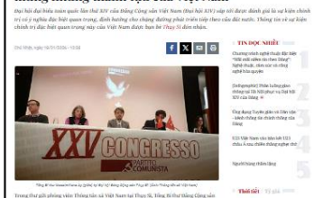
Đại hội Đảng XIV: Đảng Cộng sản Thụy Sĩ chúc mừng những thành tựu của Việt Nam

7 Đại sứ Palestine nhấn mạnh ý nghĩa đặc biệt của Đại hội XIV khi quốc tế nhiều thách thức, đánh giá cao chính sách đối ngoại Việt Nam và tin Đại hội sẽ ban hành nghị quyết đúng đắn vì lợi ích nhân dân và hòa bình.